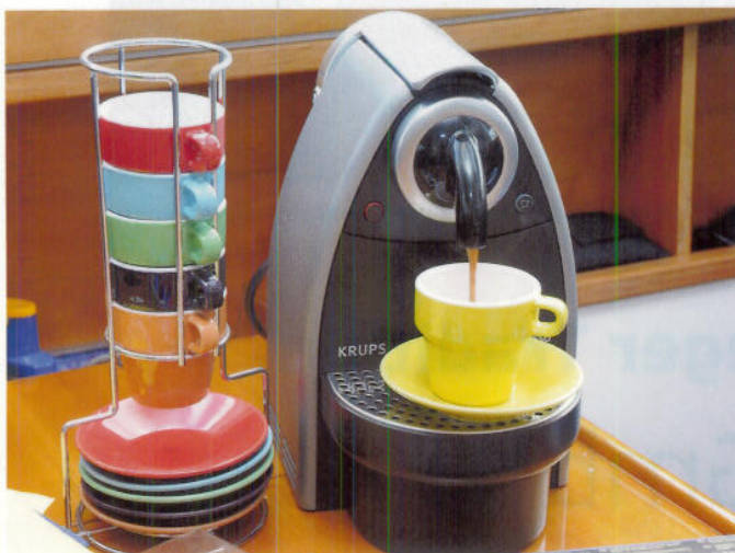
Sorgt für Ordnung und sieht auch noch chic aus. Die Menage aus Edelstahl ist standfest und fasst sechs Espressotassen mit Tellern

Form gebracht und anschließend spielend leicht zu reinigen. Letzterer Vorteil zeichnet auch die Kochlöffel aus Silikon aus. Durch die glatte Oberfläche bleibt kaum etwas an ihnen kleben, was den Aufwand beim Spülen natürlich erheblich reduziert. Äußerst praktisch und vielseitig einsetzbar sind auch die modernen, flexiblen Schneidbretter aus Kunststoff. Sie sind in den unterschiedlichsten Farben erhältlich und sehr widerstandsfähig. Die Zutaten werden darauf zerkleinert und dann mit dem zum Teil gerollten „Brett“ gleich in die Pfanne gegeben. Nach dem Abwischen können sie auch als dekorative Tischsets eingesetzt werden. Unser „Bretter“ fanden wir übrigens in einem großen schwedischen Möbelhaus. Hübsche, dabei platzsparende Accessoires kann man mitunter auch beim Discounter für schmales Geld ergattern. So auch die Espresso-tassen im Edelstahlständer. Die haben an Bord von Harrys „Harry's“ jetzt ihren festen Platz in einem Fach in der Seitenwegerung gefunden, gleich neben der kompakten Kaffeemaschine. Haben auch Sie den ein oder anderen cleveren, dabei platzsparenden Küchenhelfer an Bord? Lassen Sie es uns doch einfach wissen, am besten mit Bild.