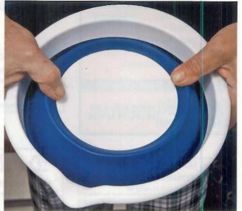
Ruckzuck wird aus der flachen Scheibe eine vollwertige Schüssel. Der Boden und der Rand mit Ausguss sind aus stärkerem Material