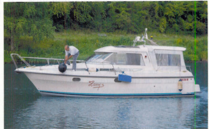
Smut, Matrose und Skipper zugleich: Harry de Scheppers Nimbus 31 Coupé ist das 9,20 m lange Kochstudio der Skipper-Redaktion